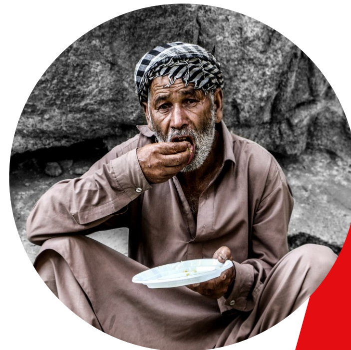
Sult og fødevaremangel